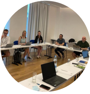
Primera formación en Chipre, mayo 2022

Durante el proyecto, se han organizado diferentes eventos para presentar los resultados del proyecto (dos formaciones para tutores de FP y dos eventos finales de diseminación). Además, se realizaron actividades en cada país para testar la calidad de los materiales.