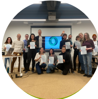
al 2lea training pentru formatori, Germania, Noiembrie 22